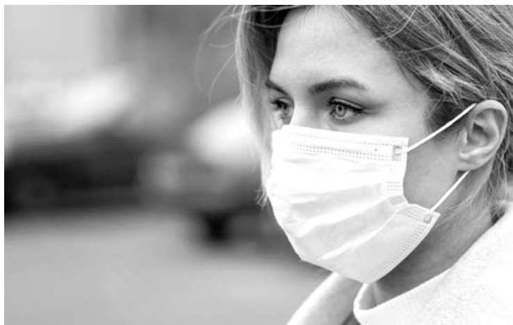
Norint apsaugoti save bei kitus, būtina laikytis visų prevencijos priemonių.

„Kiekvienas žmogus, abejojantis kaukių apsauga, turėtų suprasti, kad šis virusas plinta oro lašeliniu būdu – kalbant, čiaudint ar kosint iš mūsų nosiaryklės ir organizmo virusas patenka į išorę ir nuskrenda tam tikrą atstumą. Norint sustabdyti oro lašelių plitimą ir sumažinti riziką užkrėsti aplinką ar palietus veidą užsikrėsti pačiam, – rekomenduojama dėvėti kaukę,