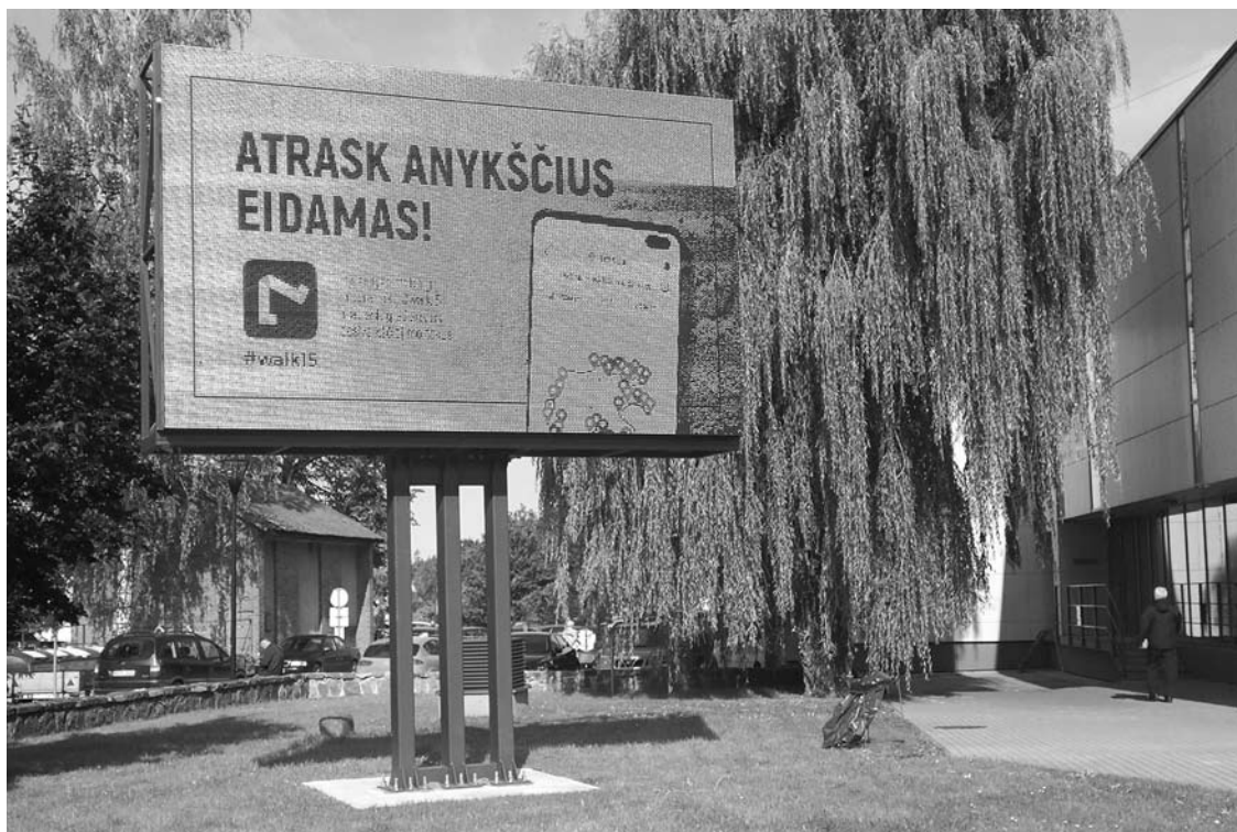
Anykščių rajono valdžia mano, kad lauko ekranas smulkiajam rajono verslui gali padėti atsitiesti po sunkumų, kuriuos sukėlė koronaviruso pandemija.