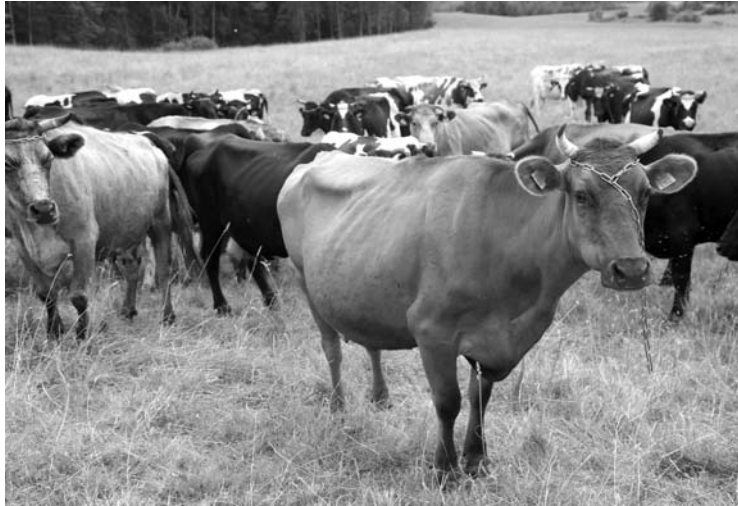
Tik susivieniję smulkūs pieninės galvijininkystės ūkiai gali būti didelė jėga.