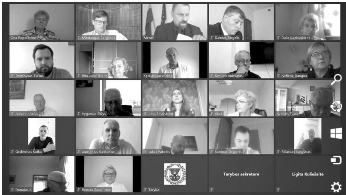
Anykščių rajono taryba nuotoliniu būdu posėdžiauja nuo šių metų pavasario.