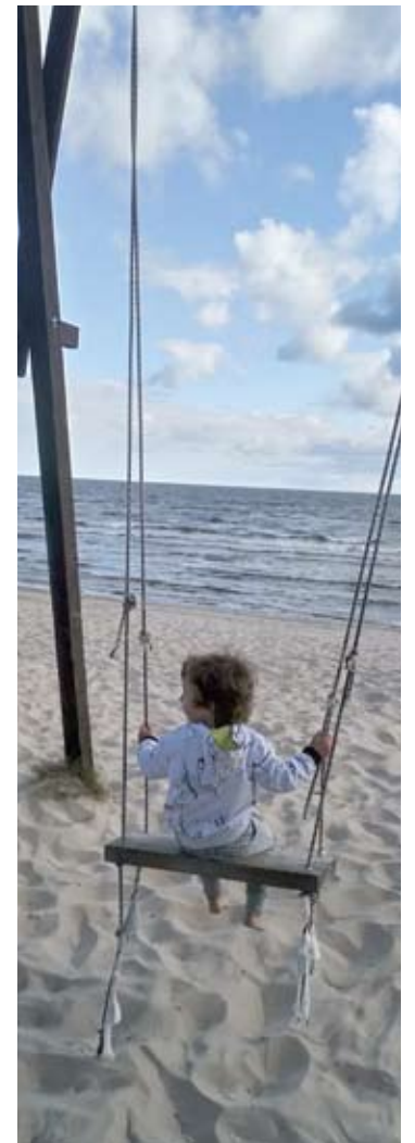
Smėlis, jūra, sūpynės...